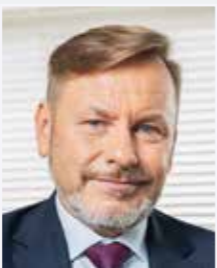
Rafał Szymtke Prezes Polskiej Organizacji Turystycznej

Wspólnie wypracowane wnioski i rekomendacje Gremium stanowiąc będą dla administracji rządowej do spraw turystyki ważną podstawę formułowania kluczowych kierunków działania i interwencji państwa na kilka najbliższych lat, przyczyniając się do zrównoważonego rozwoju sektora turystycznego oraz do tworzenia nowej jakości w zarządzaniu turystyką w Polsce.