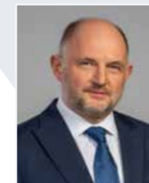
Piotr Całbecki Marszałek Województwa Kujawsko-Pomorskiego

W obliczu dynamicznie rozwijającego się świata zmiany kształtowane przez szereg uwarunkowań społecznych, technologicznych, środowiskowych i politycznych przechodzi także branża turystyczna. Sytuacja międzynarodowa nadała im nieprzewidywalny rytm, ale również wypukliła pewne kierunki rozwoju.